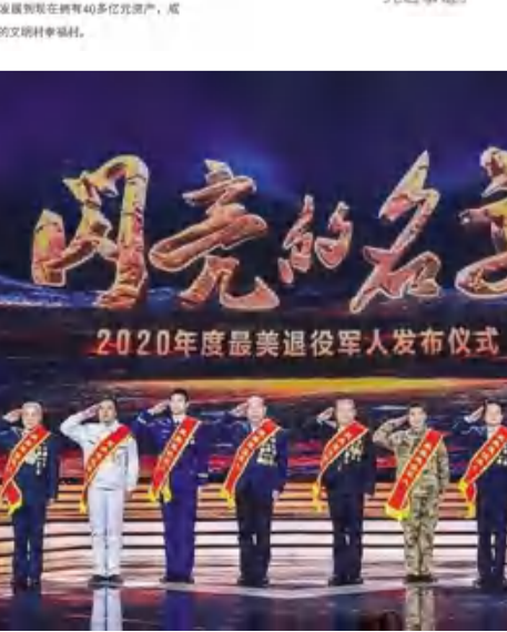
▲颁奖典礼为第二组2020年度“最美退役军人”颁奖