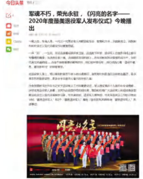
▲颁奖典礼为第二组2020年度“最美退役军人”颁奖