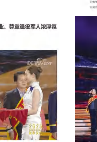
▲颁奖典礼为第二组2020年度“最美退役军人”颁奖