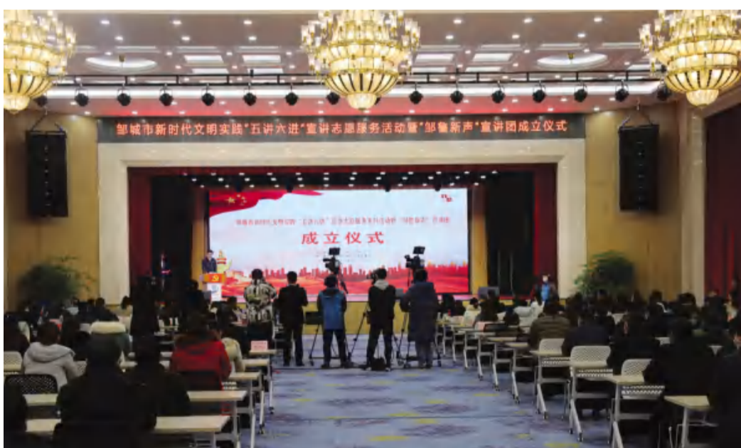
12月28日，邹城市新时代文明实践“五讲六进”宣讲志愿服务活动暨“邹鲁新声”宣讲团成立仪式在后八里沟村新时代文明实践大讲堂举行。市委常委、组织部长梁伟出席活动并致辞，钢山街道党工委书记王勇上台讲话。