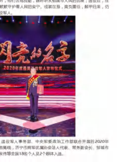
▲颁奖典礼为第二组2020年度“最美退役军人”颁奖