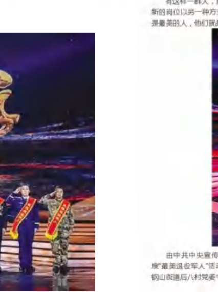
▲颁奖典礼为第二组2020年度“最美退役军人”颁奖