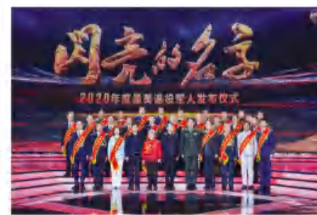
▲颁奖嘉宾与2020年度“最美退役军人”合影留念