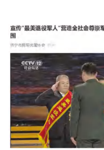
▲颁奖典礼为第二组2020年度“最美退役军人”颁奖