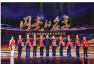
▲颁奖典礼为第一组2020年度“最美退役军人”颁奖

在退役军人身上，我们看到的是苦干奋斗的朴素烙印，是危难时刻挺身而出的热血豪迈，是永葆本