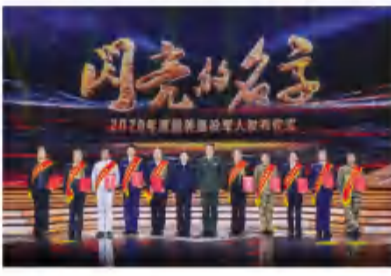
▲颁奖典礼为第二组2020年度“最美退役军人”颁奖