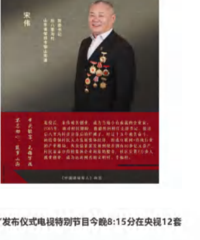
▲颁奖典礼为第二组2020年度“最美退役军人”颁奖