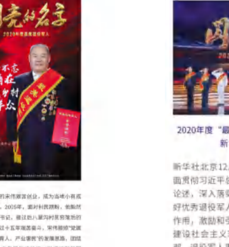
▲颁奖典礼为第二组2020年度“最美退役军人”颁奖