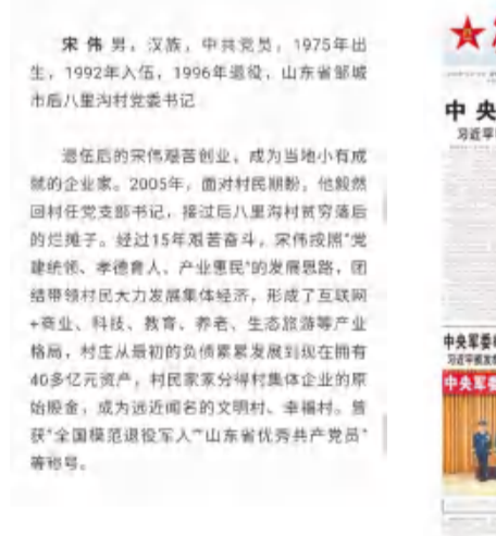
▲颁奖典礼为第二组2020年度“最美退役军人”颁奖