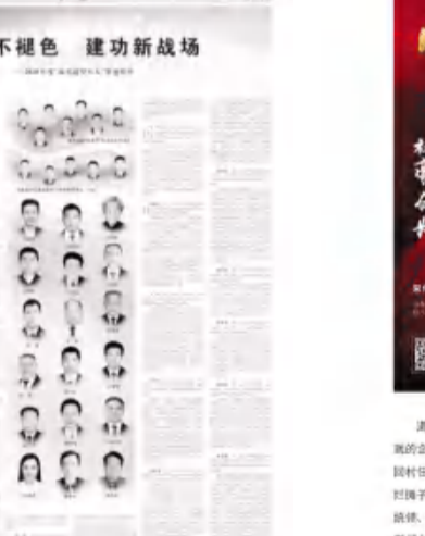
▲颁奖典礼为第二组2020年度“最美退役军人”颁奖