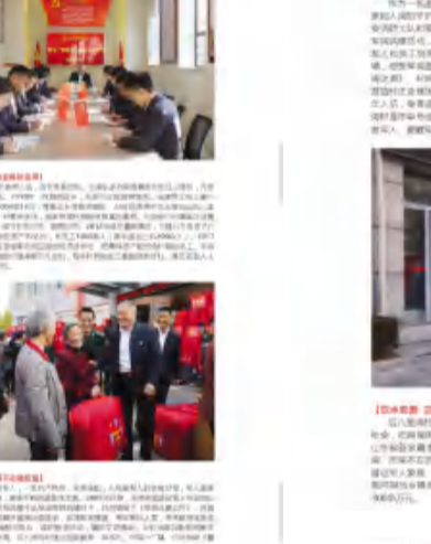
▲颁奖典礼为第二组2020年度“最美退役军人”颁奖