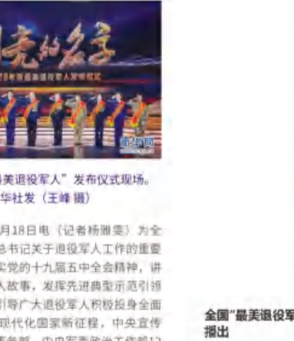
▲颁奖典礼为第二组2020年度“最美退役军人”颁奖